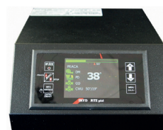
IRYD RTZ PID